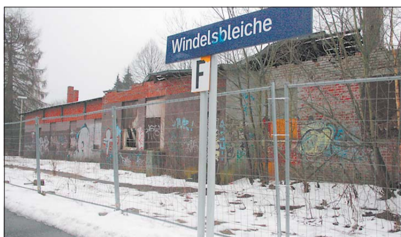
Das ehemalige Empfangsgebäude am Bahnhof Windelsbleiche ist schon seit Jahren marode. Bislang hat sich noch kein Investor dafür gefunden.